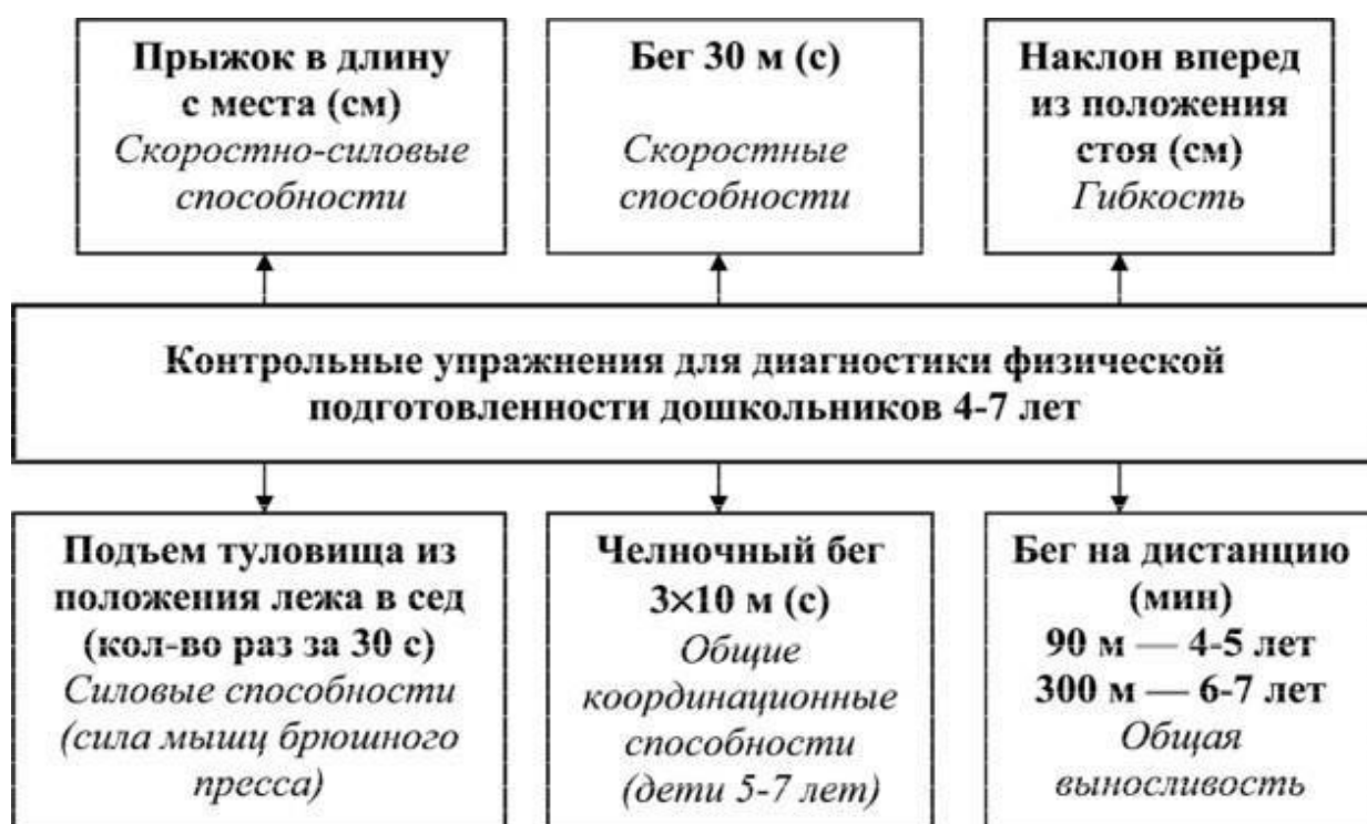
Рис.1. Контрольные упражнения для диагностики физической подготовленности дошкольников 4-7 лет.